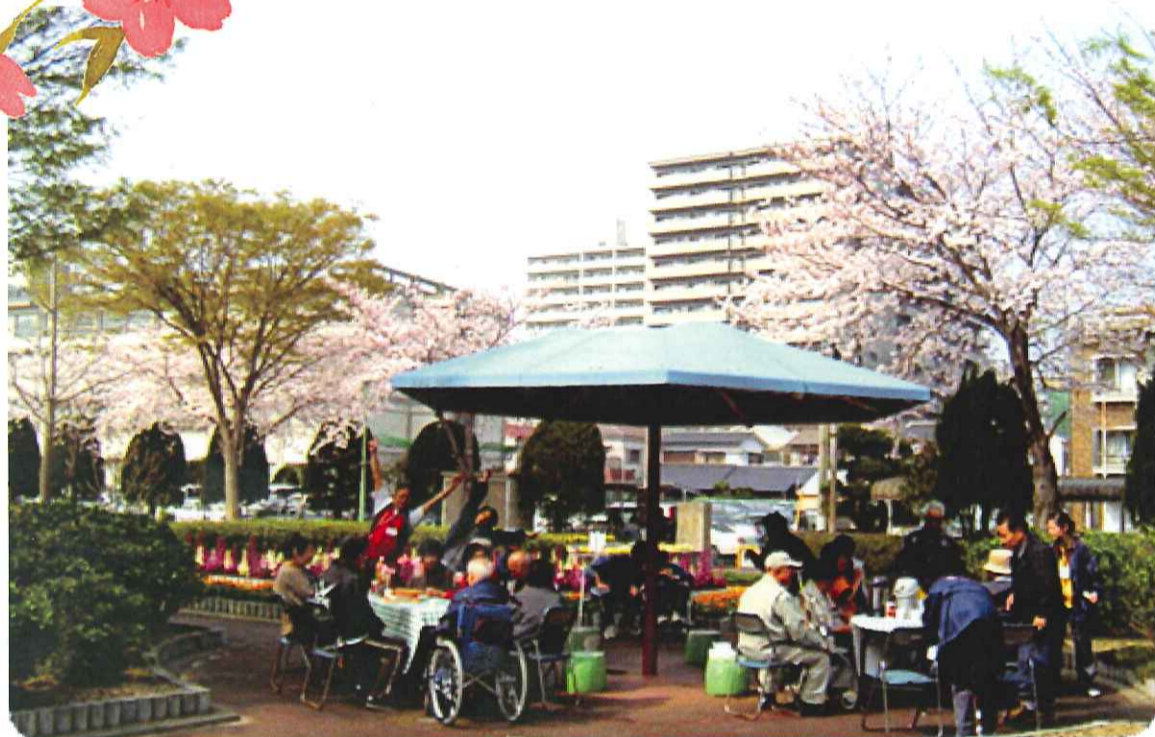
センターから徒歩10分!『速玉公園』はよく管理された、本当に素敵な公園です♪