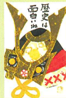
歴史は面白 絵紙/四葉様