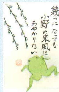
総紙 / 匠様