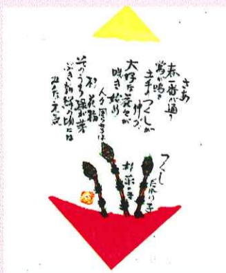
絵手紙 / 匠乙様作