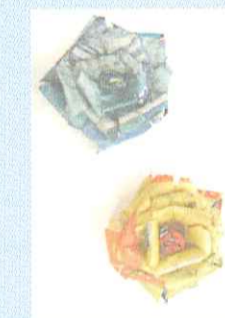
ペーパーフラワー/五枝様