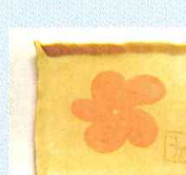
陶芸 / 寂正様