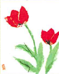
ちぎり絵/ヨシエ様