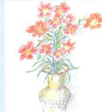
絵画 / Y.S様