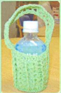
ボトルケース/初子様