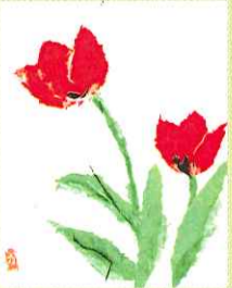
ちぎり絵/ヨシエ様