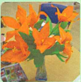
ペーパーフラワー/参加者皆様