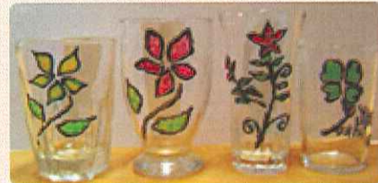
ガラスアート/参加者皆様