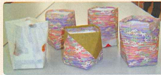
リサイクル小物/参加者皆様