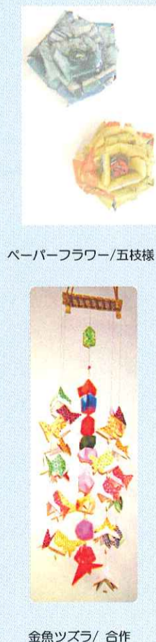
ペーパーフラワー/五枝様 金魚ツズラ/ 合作 紙折紙 / 四枝様 絵画 / Y.S様 陶芸 / 寂正様