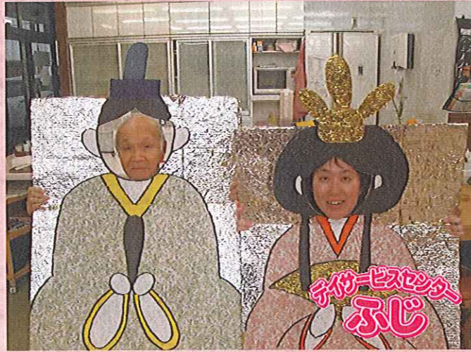
手作りのお内裏様とお雛様で記念撮影

3月3日は「桃の節句、雛祭り」 桃の節句の起源は非常に歴史があり、 古くは平安時代には遡ります。 昔の日本には5つの節句があり、 そのうちのひとつ「上巳の節句」が 現在の桃の節句にあたるそうです。 「季節の節目に清める大切な行事、 日本文化の伝統を大切にします！」