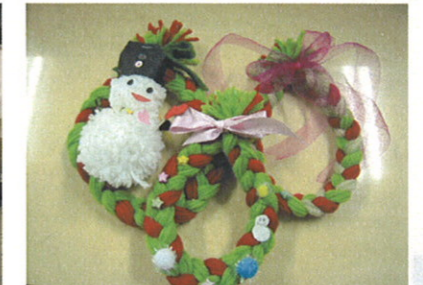
もうすぐクリスマスリース☆ &毛糸の雪だるま