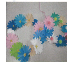
折り紙コスモスのリース

ふじ防府最近の手芸です。 毎月、毎週、様々な手芸をご用意しています☆ その時々季節に合った手芸や、その時々ひらめいた 手芸を皆さんと作っています☆