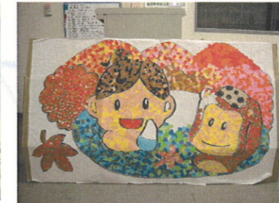
皆さん力を合わせて作った貼り絵