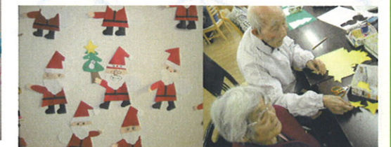
サンタクロースの飾り絵