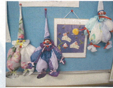
ハンカチ1枚でピエロ♪