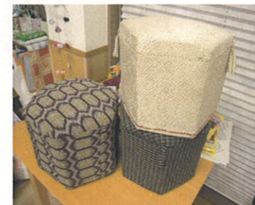
牛乳パック!?足置き

ふじ防府最近の手芸です。 毎月、毎週、様々な手芸をご用意しています☆ その時々季節に合った手芸や、その時々ひらめいた 手芸を皆さんと作っています☆