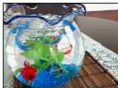
入居者様の私物ですが目に涼しい飾りです

特にこの時期は切花など長持ちがしないのですが水換えや枯れた花を取り替えるなどして1日でも長く楽しんでいただこうと世話をしています。こうして写真に撮っておくと後で見ることにもできますね。活け方は「水間流」ですので申し訳ないですが、ネクストビューふじ川内に花を添えてくれています 担当：水間