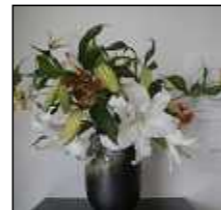
インターホンの上はお客様の目につきやすいところです。

8月になりますますます厳しい暑さが続きますが体調など崩されてないでしょうか？今日はネクストビューに飾ってある素敵な花たちをご覧頂きたいと思います。