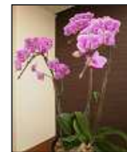
カウンターに飾ってあると雰囲気がガラリと変わり