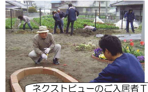
ネクストビューのご入居者T様 大活躍！！

園芸プロジェクトでは、ふじの家川内とネクストビューふじ川内の間の渡り廊下の広場に花壇を作成しています。ネクストの入居者様も花壇作りにご協力してくださいました。皆さんで見に来てくださいね♪