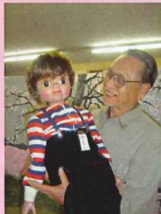
下松社会福祉協議会 小鳩会 様