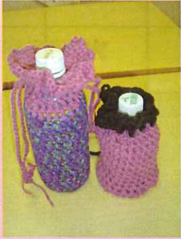
ペットボトル入れ