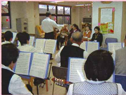
駒菊マンドリンクラブ 様