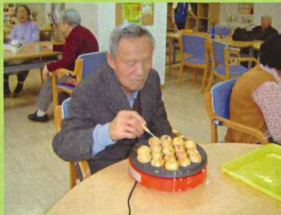
たこ無し「たこ焼き」作り ノッキング倶楽部