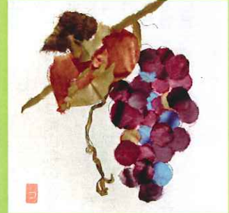
ちぎり絵（葡萄）ノ月谷様