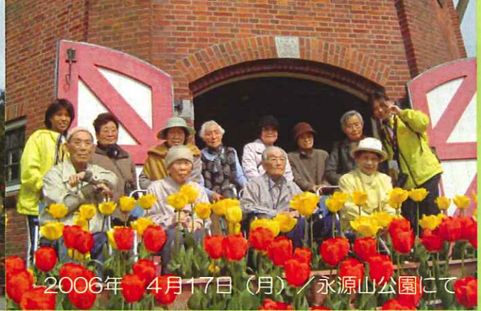
2006年 4月17日 (月) / 永源山公園にて