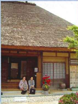
● ぷち旅行 (5/31)