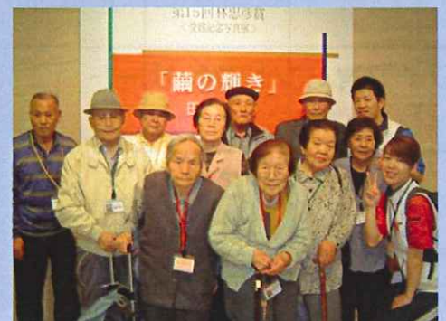
● 美術館来訪 (5/19)