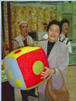
● KRY訪問 (5/22・27)