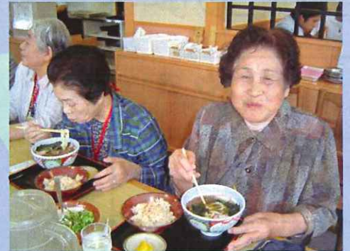
● 突撃！隣の昼ご飯 (5/30)