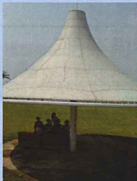
● 親水公園散策 (5/30)