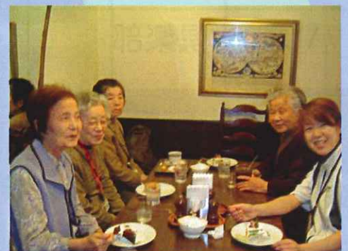
● 喫茶店めぐり (5/15・23)