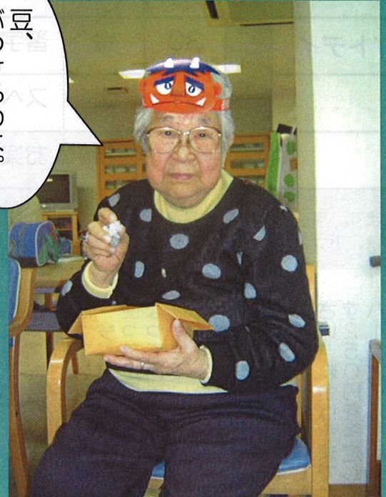
■2007年2月1日・2日・3日 『節分祭』