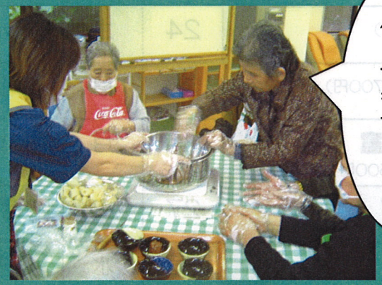
■2007年2月14日 『ヴァレンタインデイ』