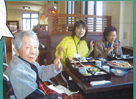
■2007年1月30日 『突撃！隣の昼ごはん!!』