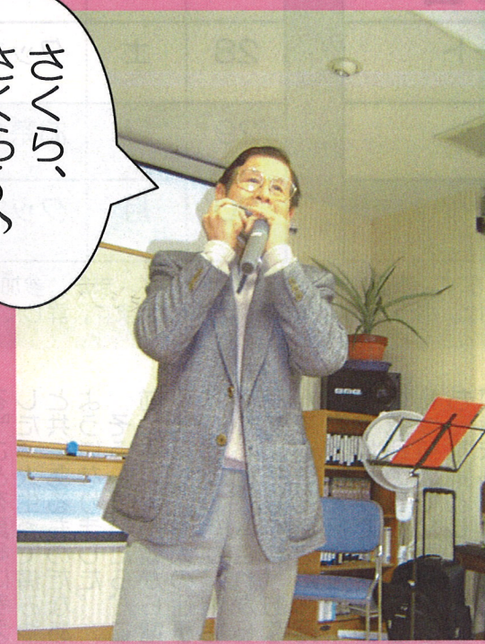
■2007年3月1日 ハーモニカコンサート/鳥越監査役