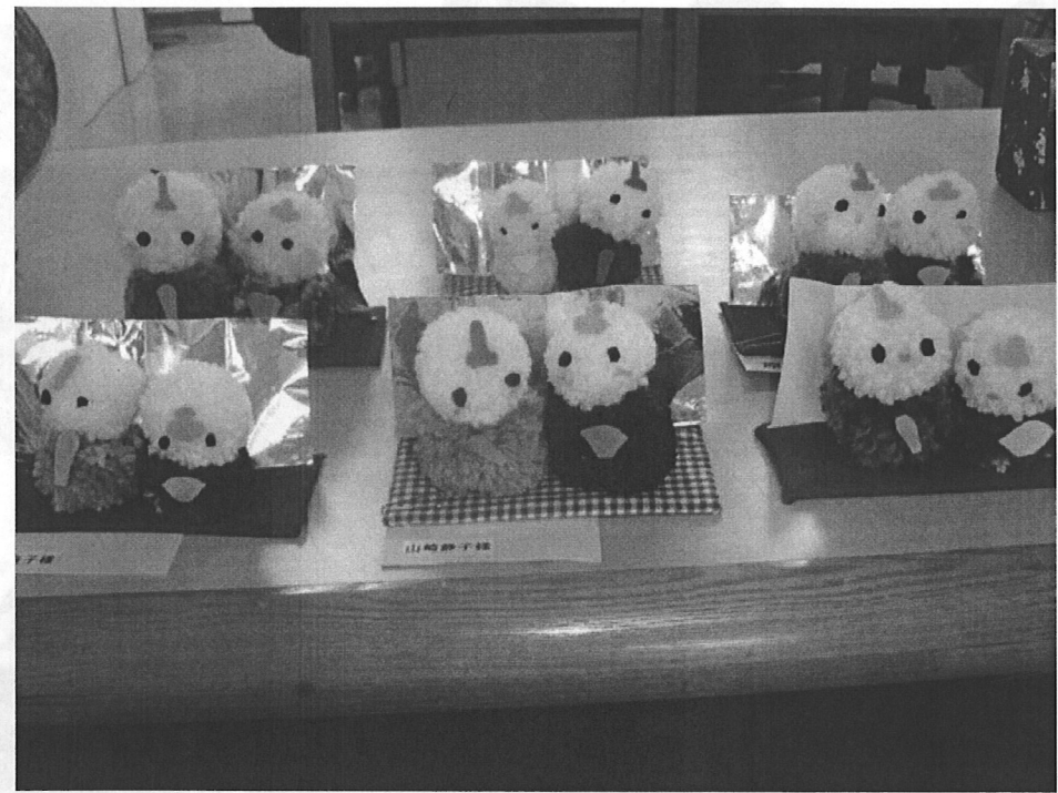
■ボンボンひな人形

※ 外出(★印の付いた行事)は希望者のみで出掛けます。事前に参加希望を募ります。また、参加される方の入浴・癒しはございません。 ※ 教室と表記されているレクリエーションに関しては、ボランティアの講師が来られます。詳しくは、スタッフまでお問い合わせ下さい。