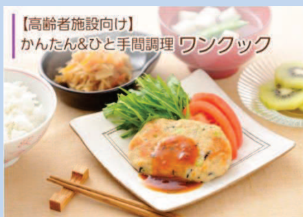
【高齢者施設向け】 かんたん&ひと手間調理 ワンクック